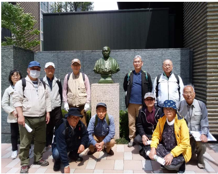
③ 古河市兵衛商店 (胸像) 前